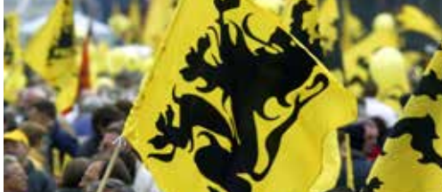
Programma Elfdaagse zie p. 2