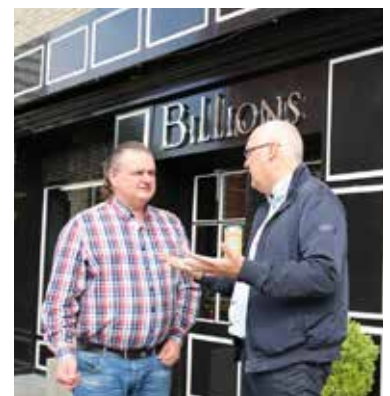
▲ Een vriendelijke schepen op zoek naar de meest klantvriendelijke winkelier.

Kopen in Brasschaat, waar voor je geldt!