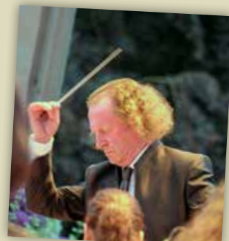
▲ ... en de maestro.