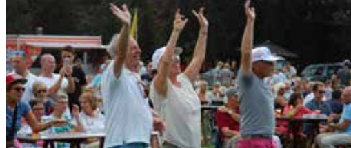
Dit jaar vijfde keer Jan & Alleman zie p. 3