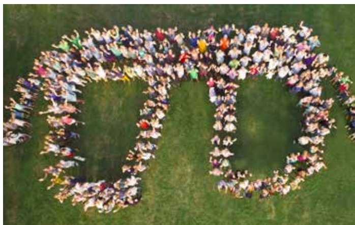
▲ Satellietbeeld van Jan & Alleman editie 2016