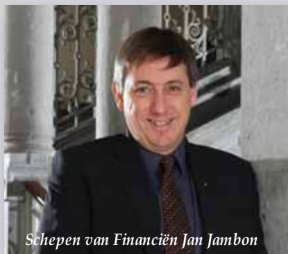
Schep van Financiën Jan Jambon

Gastheer: Brasschaats schep van Financiën Jan Jambon (N-VA).