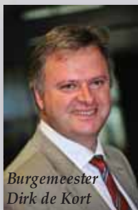
Burgemeester Dirk de Kort

Zondag 20 december om 11.00 uur in dorpskerk 'de Roode Leeuw', Bredabaan 262, Brasschaat