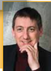
Jan Jambon Kamerlid