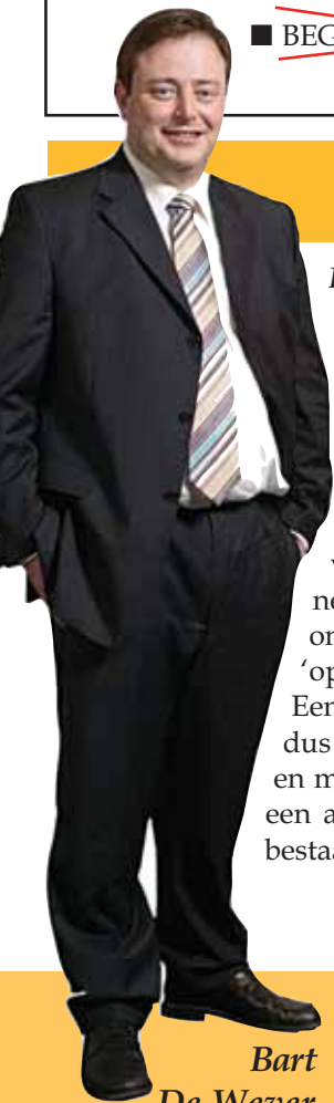
Bart De Wever N-VA-voorzitter