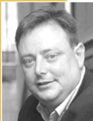
Bart De Wever Voorzitter N-VA