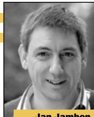
Jan Jambon 2de plaats

Daarom willen CD&V en N-VA via het project "betaalbaar wonen" de mogelijkheid geven aan jonge gezinnen om een eigen woning te verwerven in Brasschaat. Zo streven wij ernaar om gronden in erfpacht te geven waarop men het recht krijgt om erop te bouwen. In dit systeem willen we voorrang geven aan de inwoners van Brasschaat.