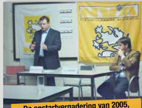
De opstartvergadering van 2005, met twee bekende gezichten.

Op tien jaar tijd is N-VA Brasschaat in sneltreinvaart geëvolueerd: van een 'vriendenclubje rond de keukentafel' naar een 'vriendenclub in een vergaderzaal'. Wij zijn erin geslaagd op die relatief korte periode het beleid te sturen, met de grootste fractie, de burgemeester, vier schepenen en vijf OCMW-raadsleden. En ik blijf een scout in hart en nieren: een helpende hand reiken aan de gemeenschap. Ik kan niet beter zitten dan bij N-VA Brasschaat.