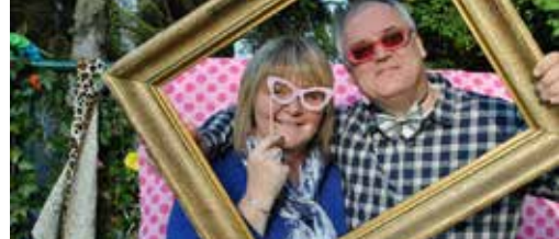
De stille kracht van N-VA Brasschaat p. 3