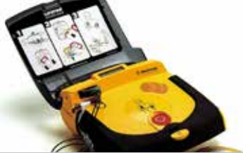
Brasschaat hartveilig p. 2